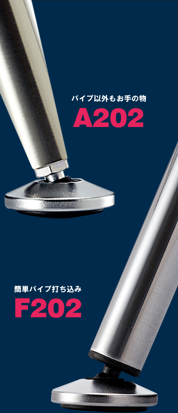
パイプ以外もお手の物